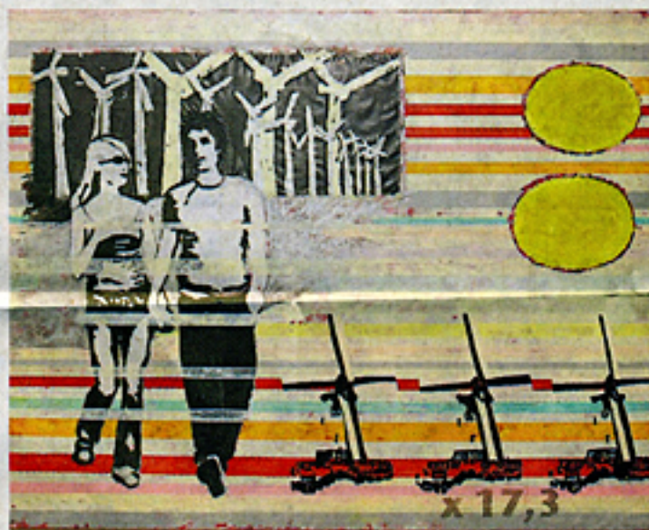
Dubbel goed weer.